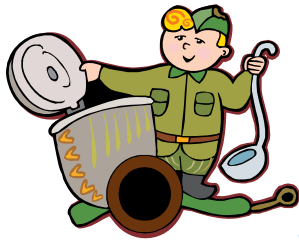
Juhani L varustevastaava